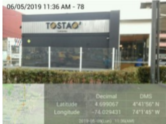
Fachada del establecimiento de comercio por Calle 46.